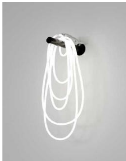
Sans-titre , néon, transformateur et support en métal, ca 60 cm, 2006.