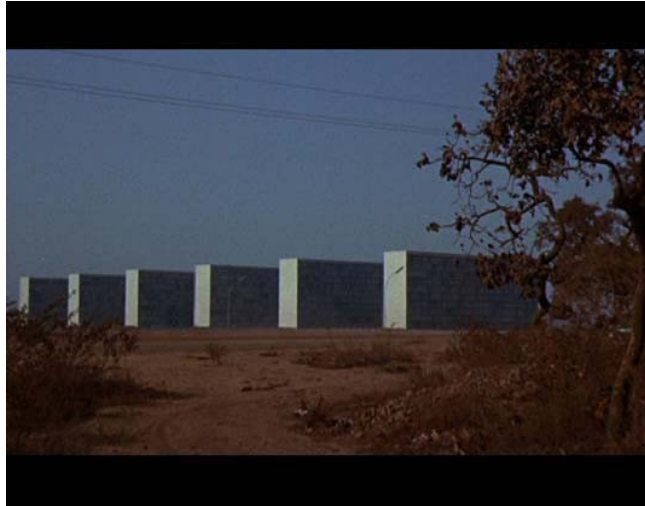
Os candagos , Vidéo couleur, DVPAL 4/3 letterbox, 8 min., 2010.

Guillaume Linard-Osorio a suivi une double formation, d'architecte et d'artiste. L'urbanisme, le paysage et l'architecture nourrissent sa production. Sa réflexion et ses recherches sur la notion de chantier, comme processus de glissement et vecteur de transition, lui permettent de mettre en abîme le passage entre l'abstrait et le concret, ainsi que l'espace ambigu, qui en résulte.