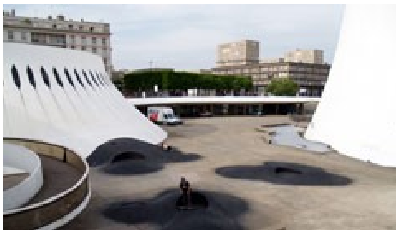
Sédiments , Vue de la sculpture dans le cadre de la Biennale d'Art contemporain du Havre, 2008.

Les installations de Vincent Lamouroux prennent comme point de départ une série d'architectures, fictives ou concrètes. Qu'elles appartiennent à la littérature, au passé ou qu'elle soit encore érigées, elles lui inspirent des modules. Selon les espaces et les références, il invite le spectateur à les parcourir, à les pratiquer, à les contempler ou à les contourner.