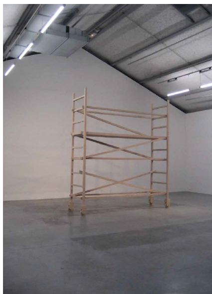
Echaffaudage , contreplaqué, dimensions variables, 2007