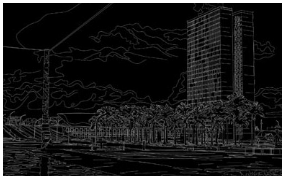
Brasilia/ Chandigarh , dessin vectoriel - impression pigmentaire sur papier Japon Kozo, 125 X 80 cm, 2008.

Le travail de Louidgi Beltrame se développe autour d'une documentation de l'architecture moderniste et de ses vestiges, et d'une déconstruction des structures formelles et narratives du cinéma envisagé comme médium avec sa syntaxe spécifique, mais aussi comme force politique ayant influencé le développement du siècle dernier.