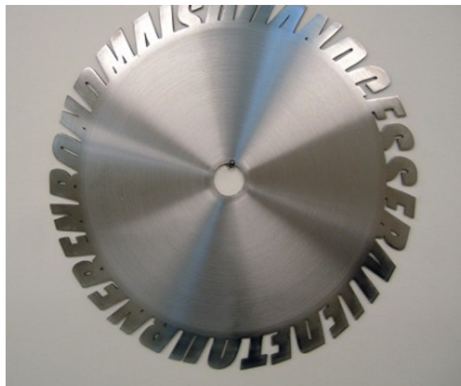
Moral d'acier (Mais quand cesseraï-je de tourner en rond) , Acier, Ø24 cm, 2008.

Dans chacune de ses pièces, Stéphanie Lagarde provoque des gestes et des actes de résistance face à la fugacité du temps qui passe, en donnant forme aux rêves, aux désirs et aux souvenirs. Ses « paradoxes » cristallisent à la fois des symboles collectifs et des questions introspectives personnelles.