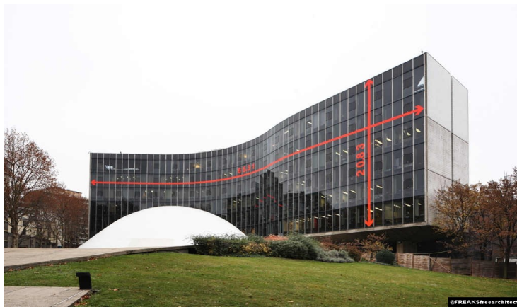
Sur Mesure , installation sur la façade du siège du PCF – Paris, 2011.

Cette plateforme de production architecturale privilégie la prospection, la recherche, l'expérimentation architecturale et plastique par la pratique du projet et du chantier. Leurs nombreux voyages et expériences dans des environnements urbains parfois chaotiques, leur ont permis de composer un corpus de scénarii urbains élargis et un vocabulaire architectural décomplexé qu'ils tentent d'exploiter au mieux dans les projets qu'ils réalisent.